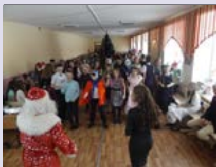
Символ год 4